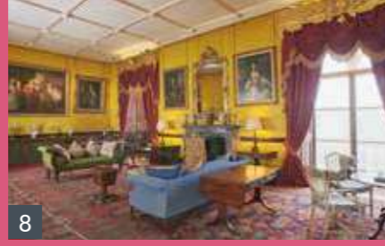
غرفة الاستقبال (٨)

زُيّنت الغرفة الثالثة من الجناح بنفس الأسلوب وتحتوي على لوحات متبقية من مجموعة أورموند.