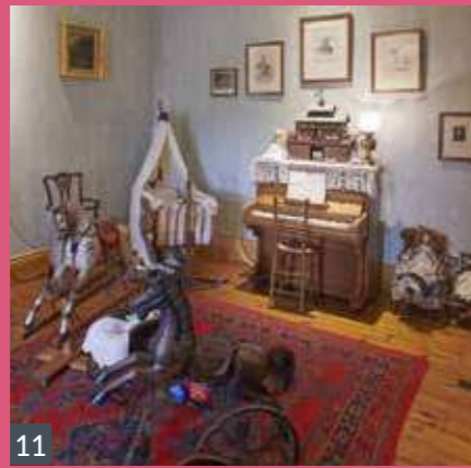
غرفة الأطفال الفيكتورية (١١)

وكان عبارة عن معرض في القرنين ٦١ و٧١، وكانت العائلة آنذاك تملك مجموعة من ٠٠٥ لوحة، وهي الأكبر في أيرلندا.